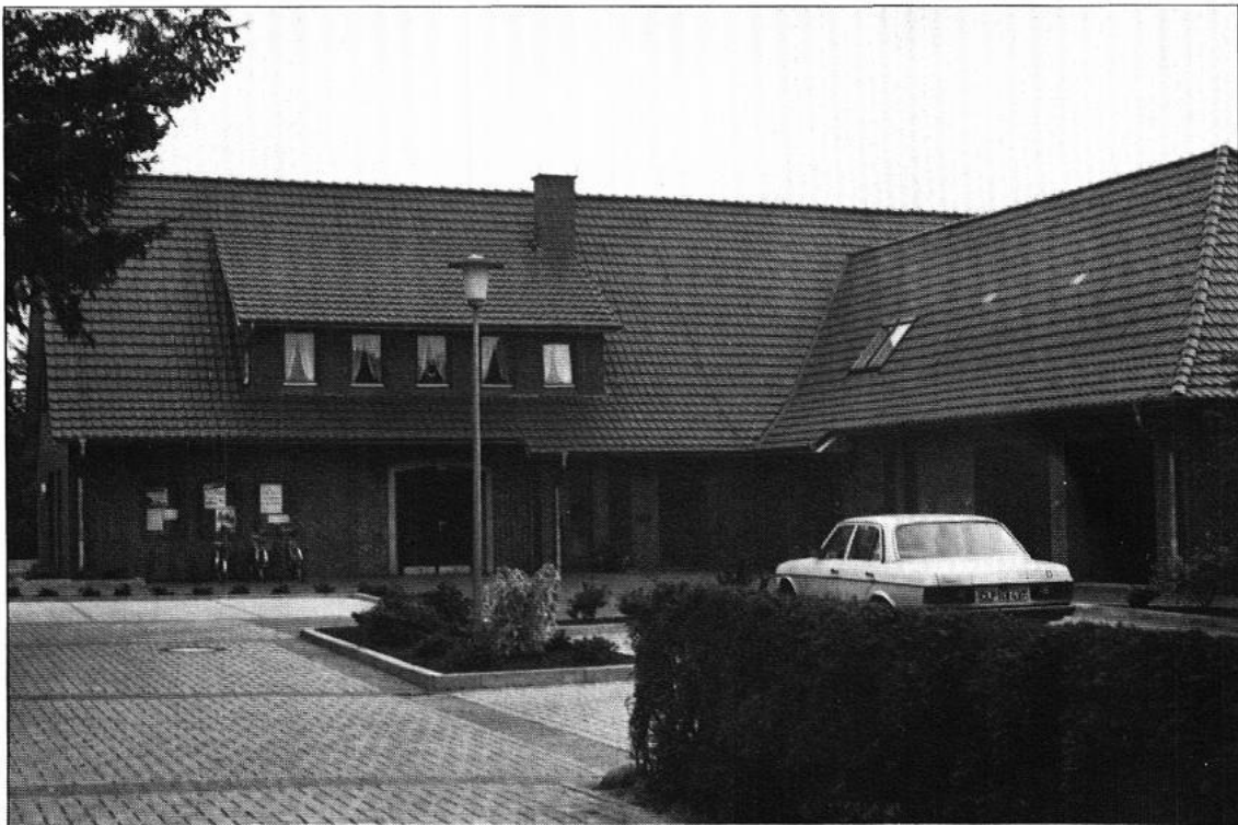
Das Franziskus-Pfarrheim Petersdorf