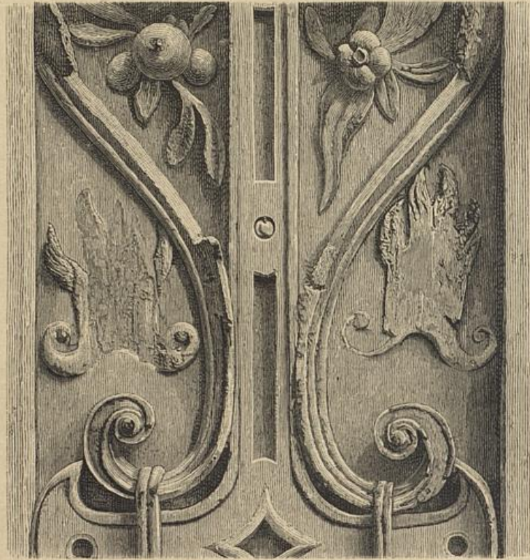
Verhältnis zum Original wie 5\frac{1}{2} zu 9.

Er hat sie nämlich in dem Mittelstreifen eines Frieses (Blatt 23 rechts) als Doppel-Ornament angebracht.