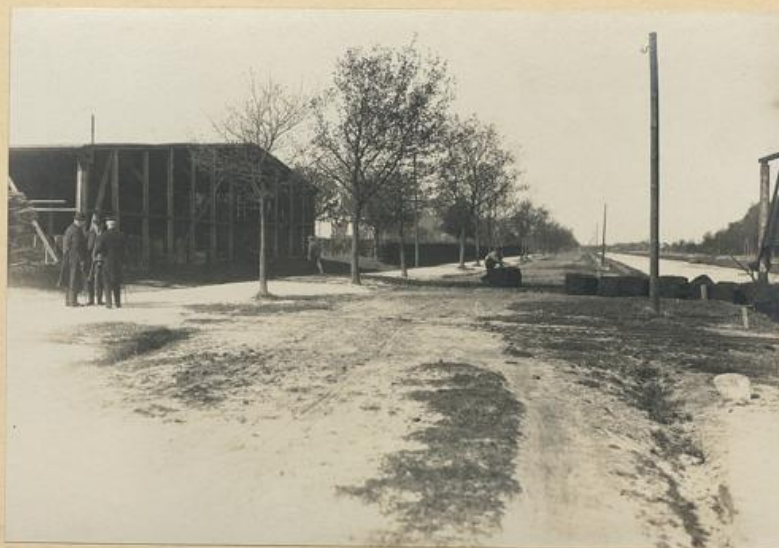
TORFSTREUWERK WITTEMOOR Abrollen fertiger Ballen ins Schiff