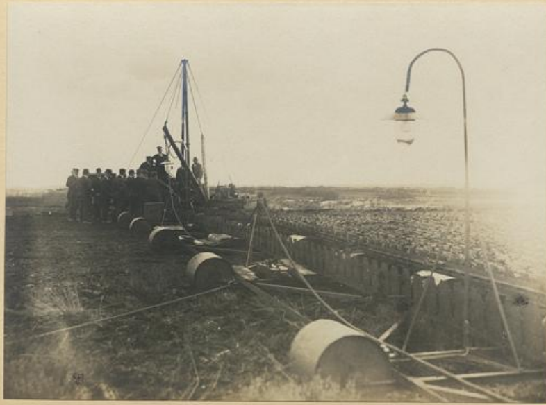
AUTOMATISCHER SODENBLEGER DES STRENGE-BAGGERS Rechts fertige Torfsoden