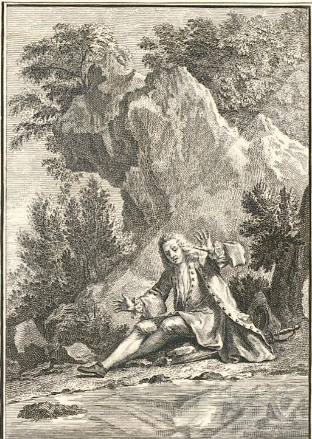
L'HOMME ET SON IMAGE. POUR M. LE DUC DE LA ROCHEFOUCAULT. Fable XI.