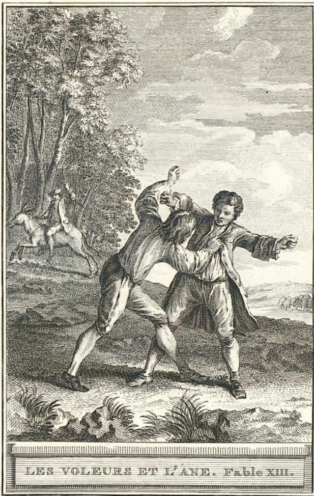
LES VOLEURS ET L'ÂNE. Fable XIII.