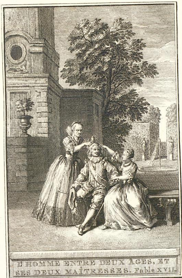
UN HOMME ENTRE DEUX ÂGES, ET SES DEUX MAÎTRESSES. Fable XVII.