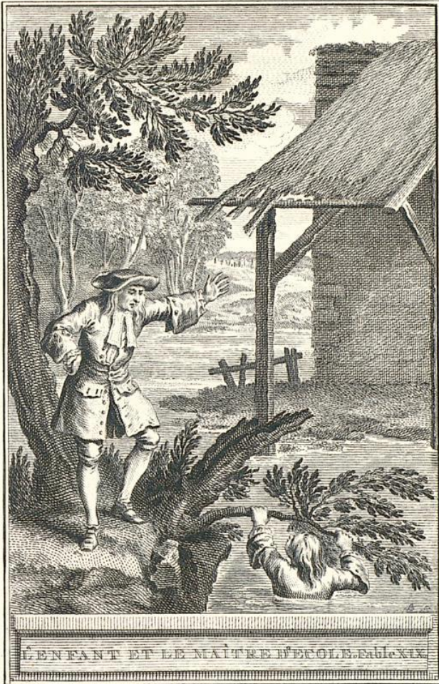
L'ENFANT ET LE MAÎTRE D'ÉCOLE. Fable XIX.