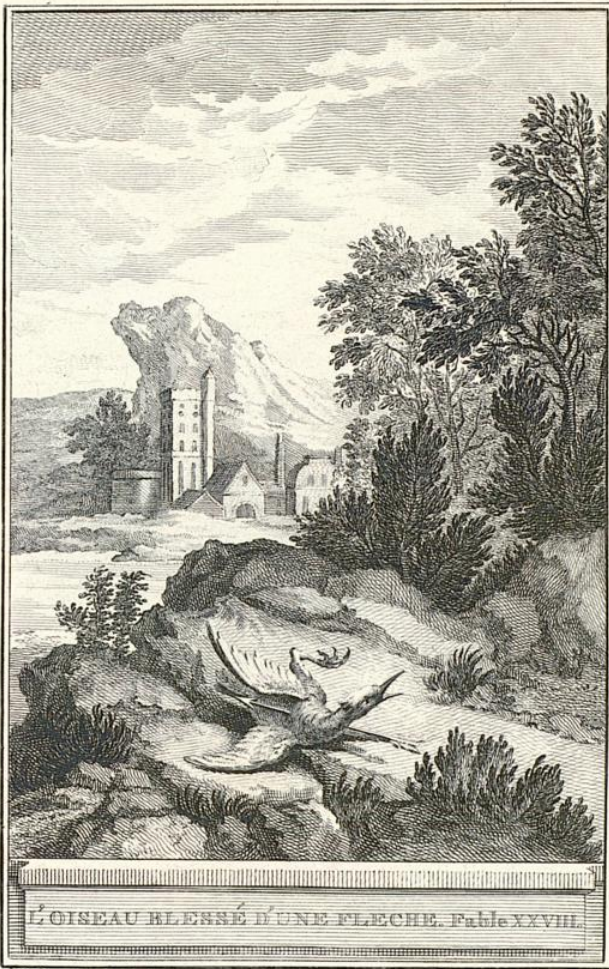
L'OISEAU BLESSÉ D'UNE FLECHE. Fable XXVIII.