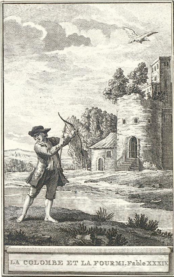
LA COLOMBE ET LA FOURMI. Fable XXXIV.

A. Duret del. et J. Leprieux sculp. 1729.