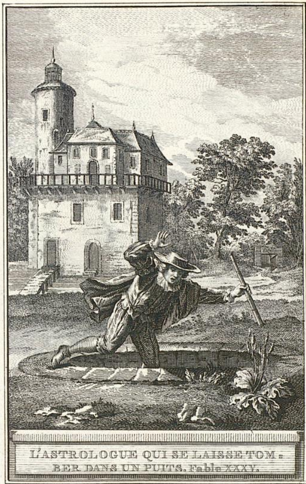
L'ASTROLOGUE QUI SE LAISSE TOMBER DANS UN Puits. Fable XXXV.