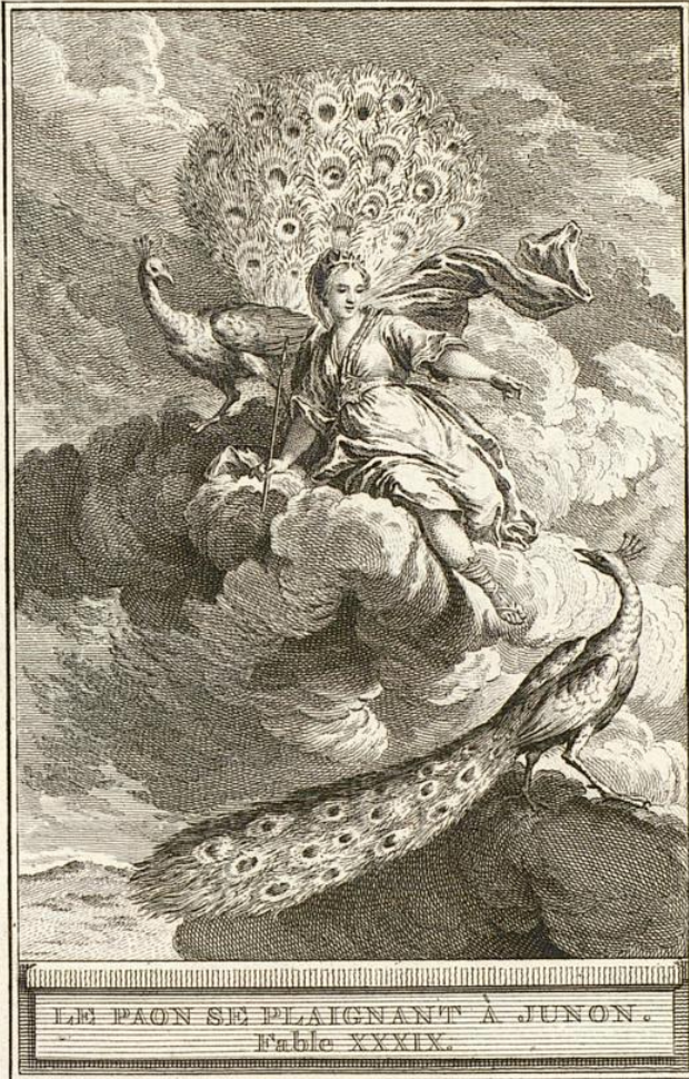
LE PAON SE PLAIGNANT À JUNON. Fable XXXIX.