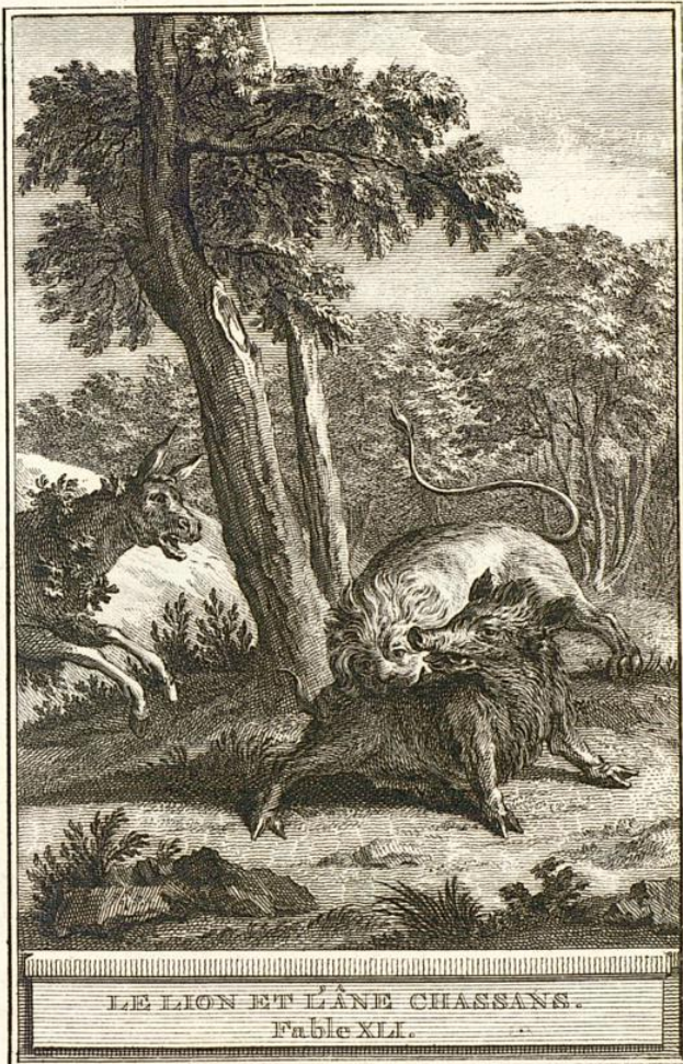
LE LION ET LE CHASSANS. Fable XL.