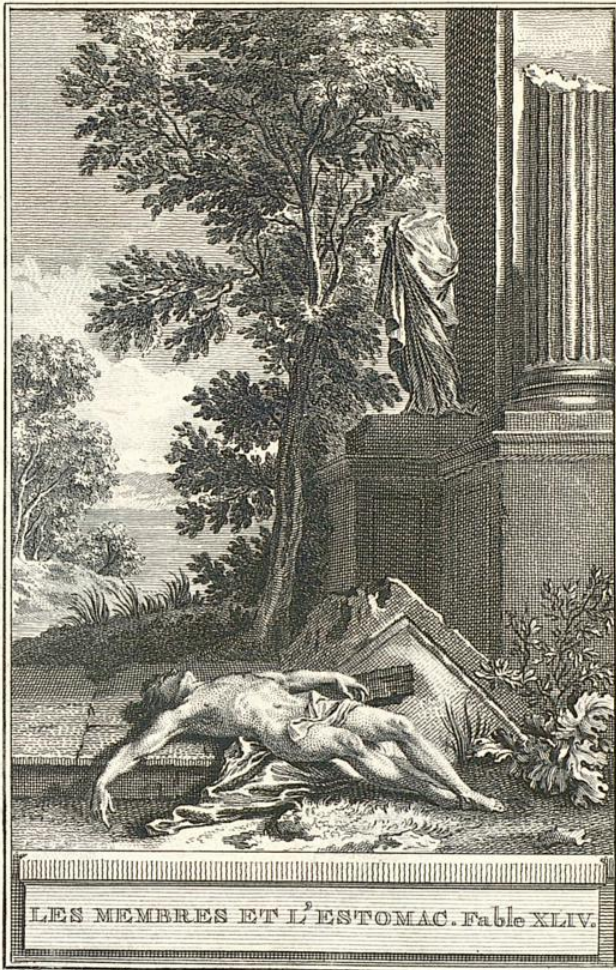
LES MEMBRES ET L'ESTOMAC. Fable XLIV.