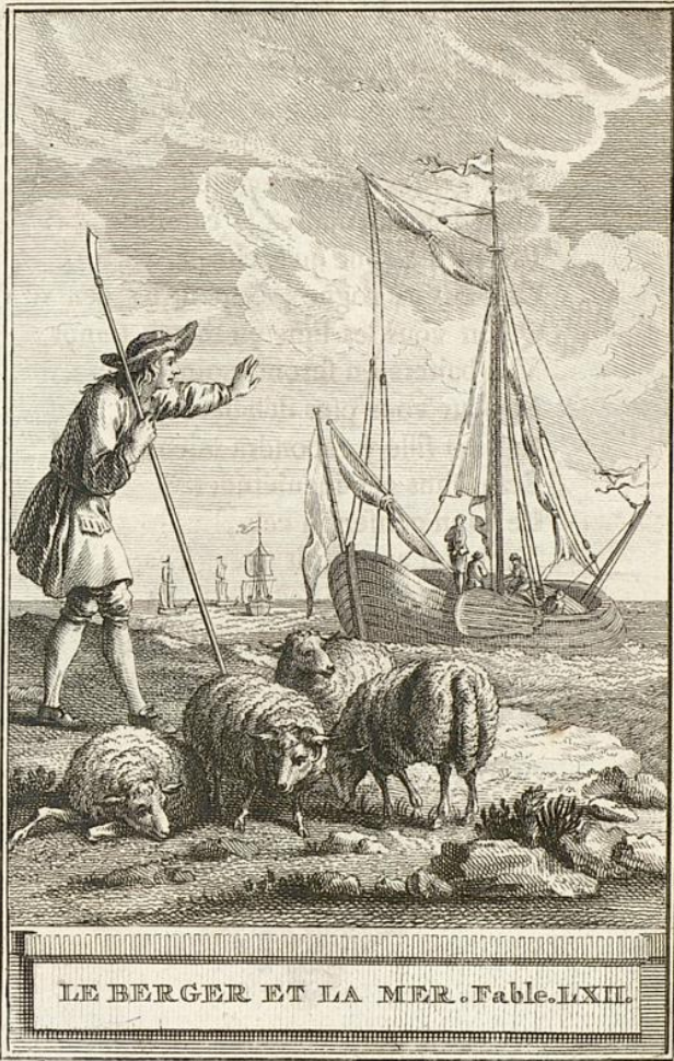
LE BERGER ET LA MER. Fable. LXXII.