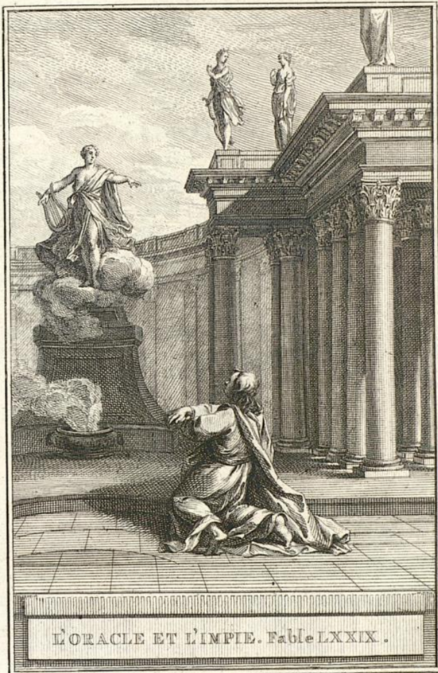
L'ORACLE ET L'IMPIE. Fable LXXIX.