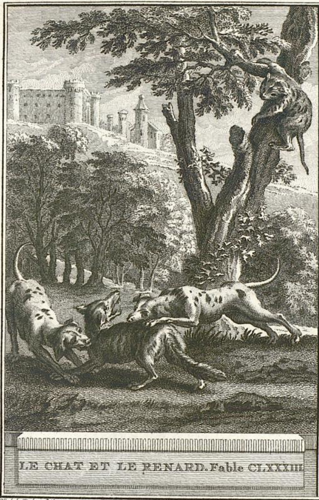
LE CHAT ET LE RENARD. Fable CLXXXIII