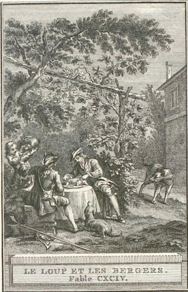
LE LOUP ET LES BERGERS. Fable CXCIV.