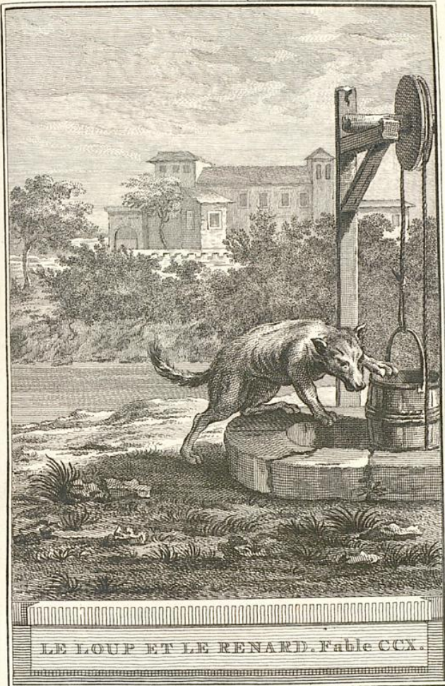
LE LOUP ET LE RENARD. Fable CCX.