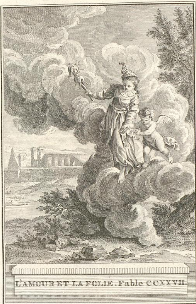
L'AMOURET LA FOLIE. Fable CCXXVII.