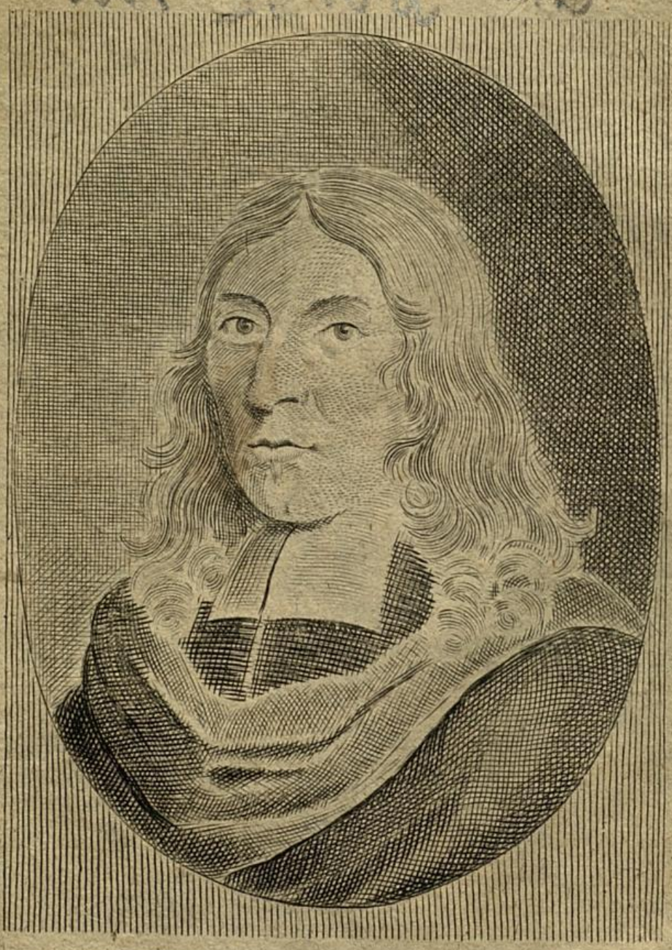
RICHARD LOWER, M.D. Practicus Londinensis longe Celeberrimus atq; Felicissimus. Etatis Suae 55.

Richard Lower, M.D. Practicus Londinensis longe Celeberrimus atq; Felicissimus. Etatis Suae 55.