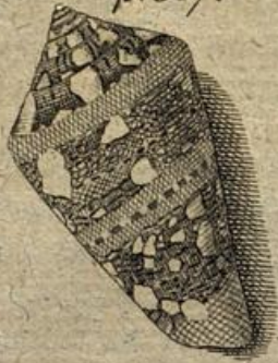
Fig. 6. p. 367.