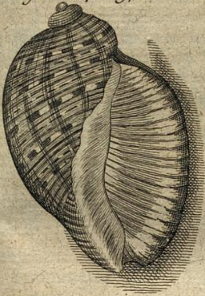
Fig. 13. p. 597.