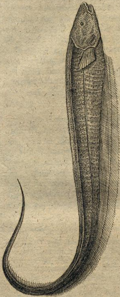
Fig. 4. p. 35.