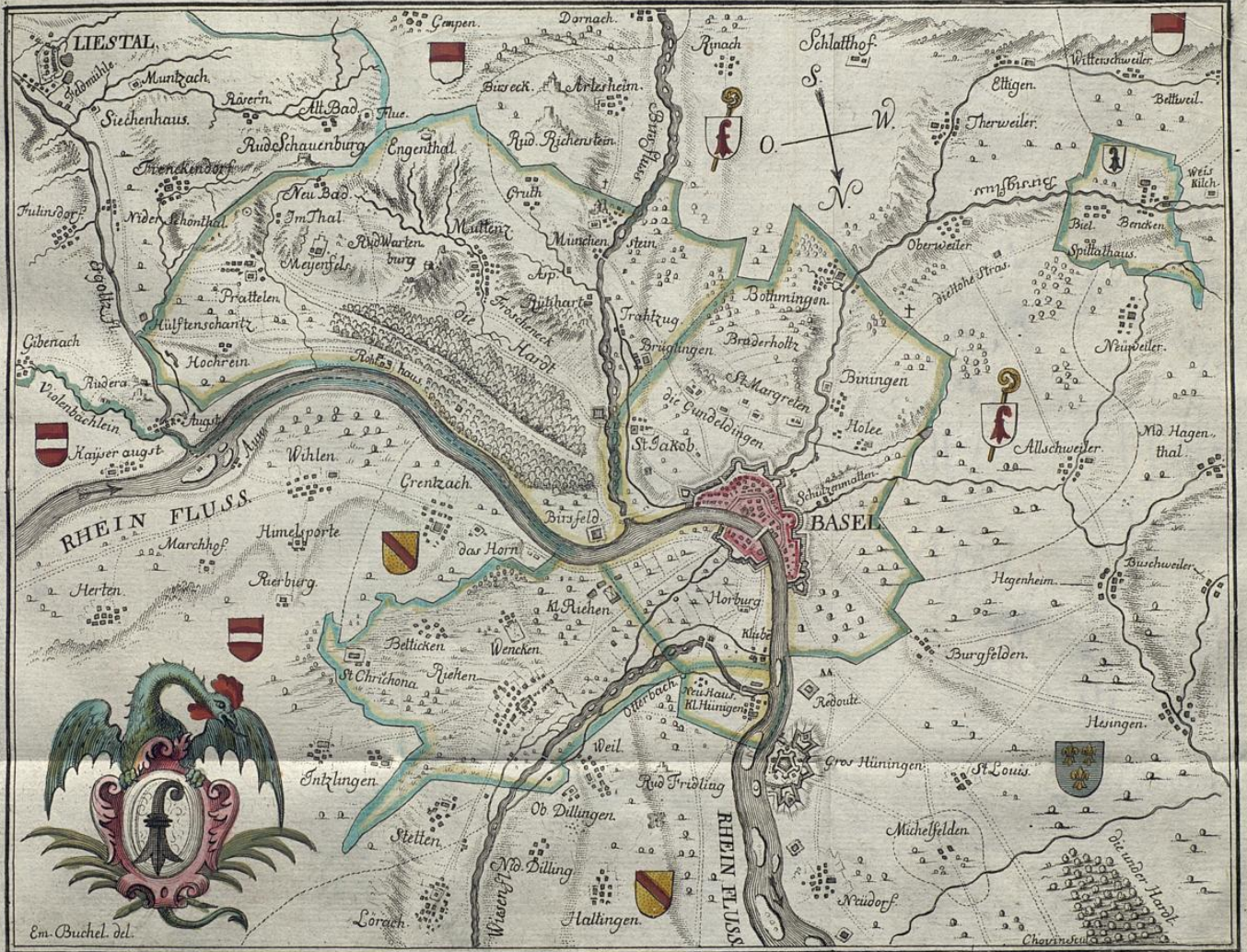
Maasstab von 1600. Basel-Ruthen oder zwei Kleine Stund