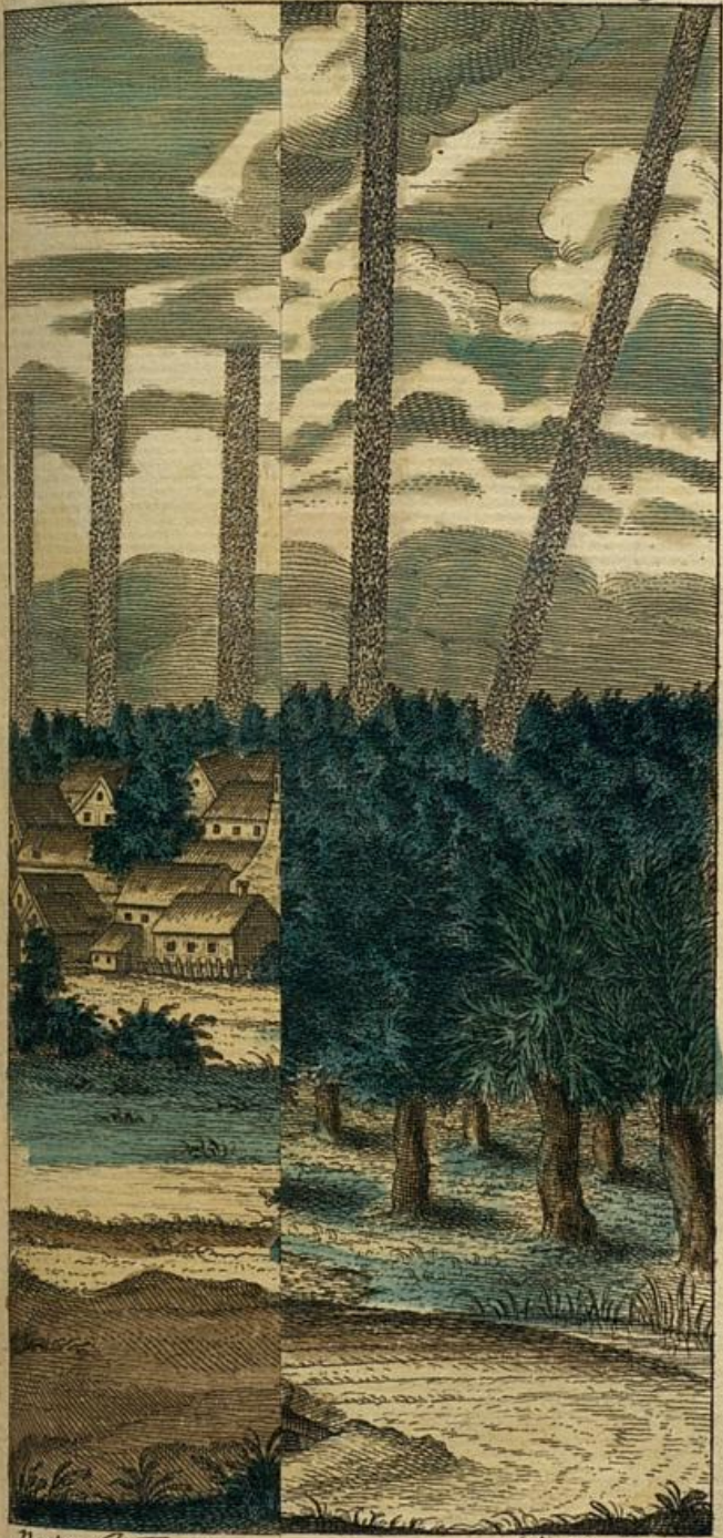
Naturf. II B.