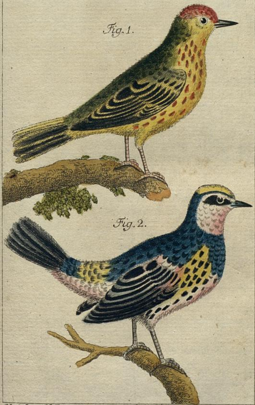
Fig. 1. Bachstelze Gefleckte. S. 65. 2. Gefrönte. 67.