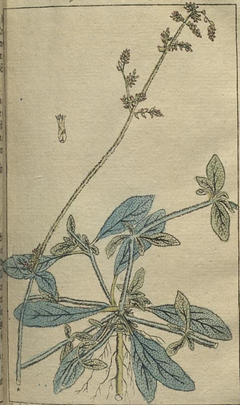
Nat. Lex. XI. 3.