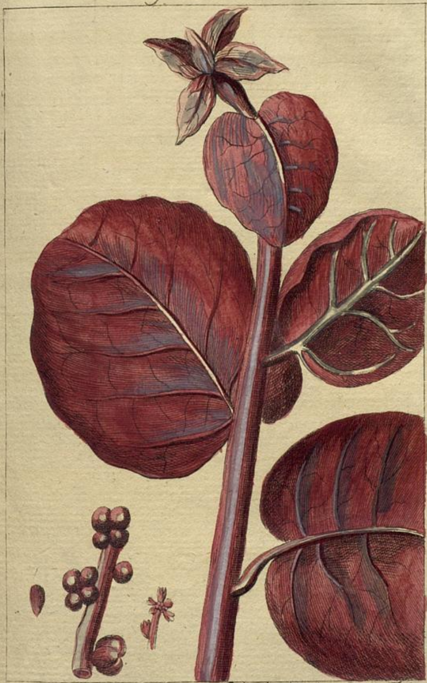
Rhede Hort. mal. VII. T. 24.