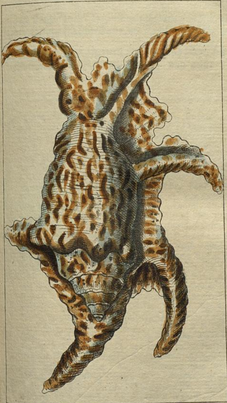
Nat. lex. IX. 12.