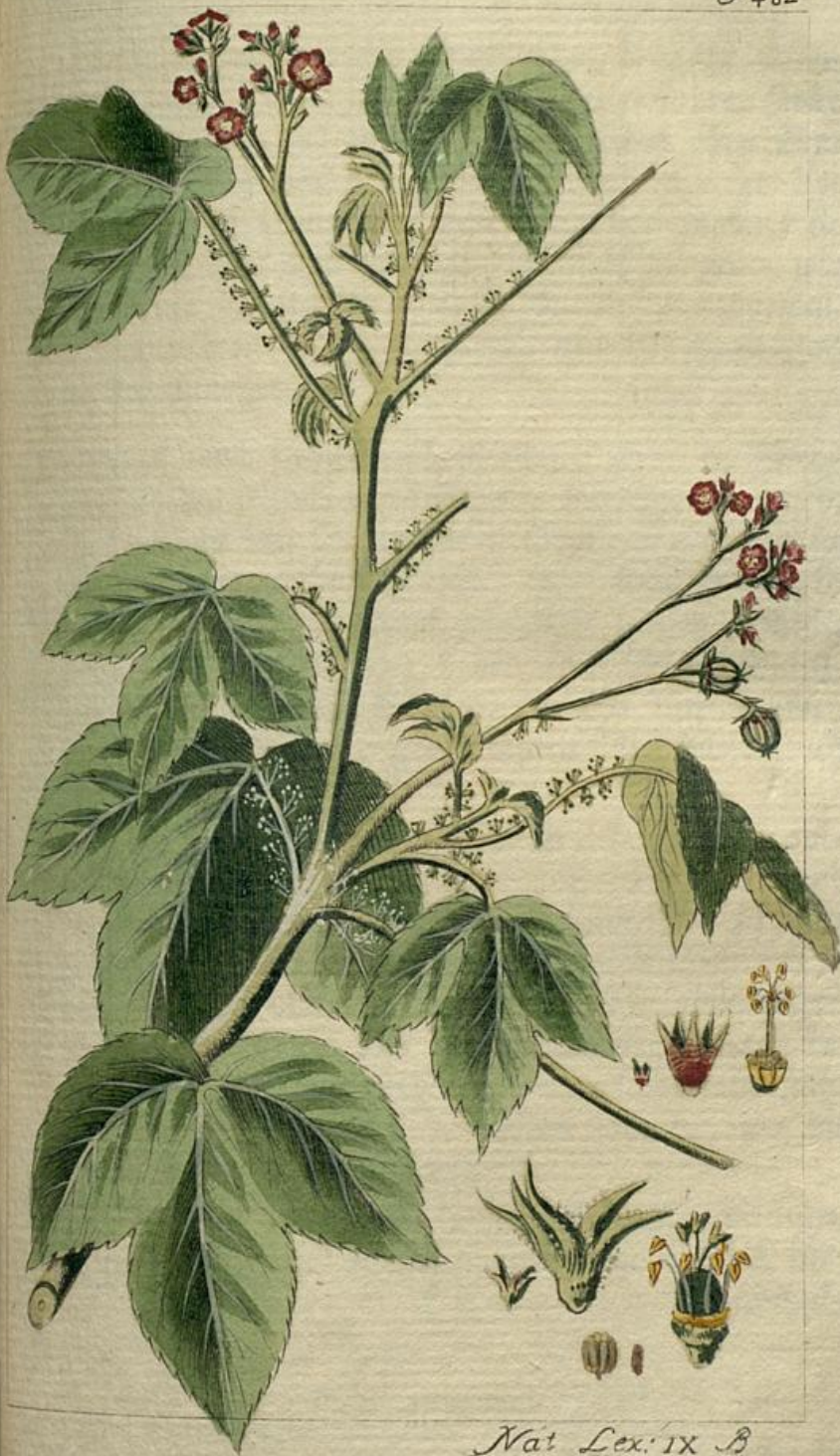
Nat. Lex. IX B