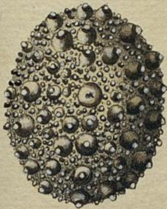
Fig. 1. S. 430.