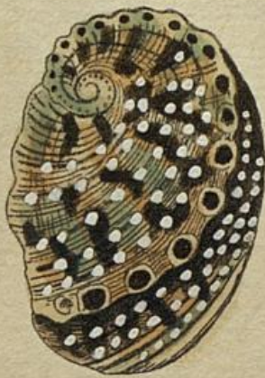
Fig. 2. S. 493.