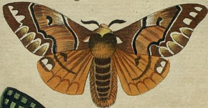
Fig. 2. S. 496.