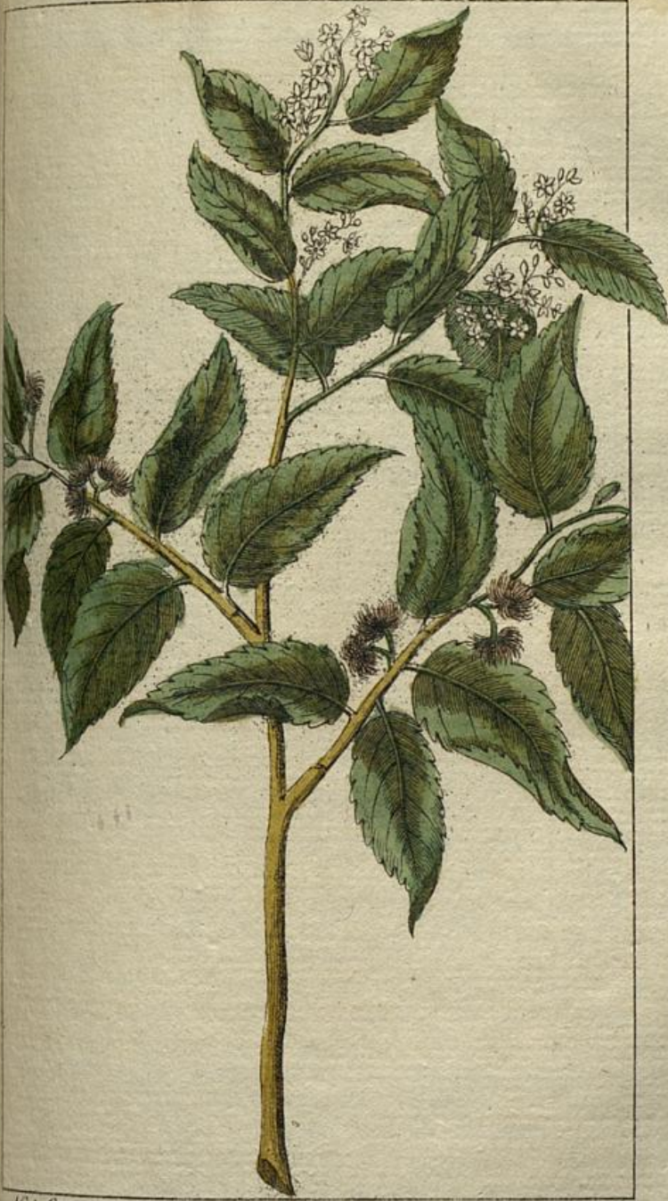
Nat. Cox. XI B.

den aufe um ien- ihre deſe ras- oten ſie Nat- mitte n in heil- den als den und mit ſato fu- agen heit hält. ta), nen, ihre u). m- rum am- Za- 22. Re-