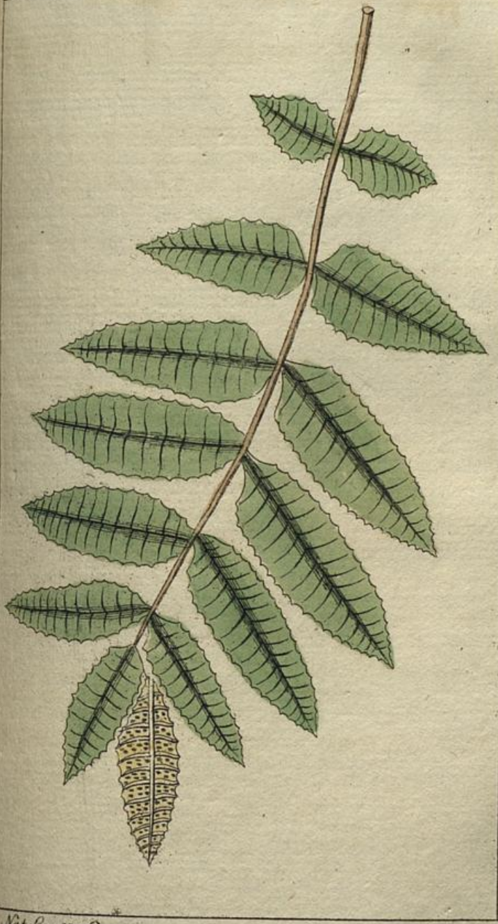
Nat. Lex XI. B.