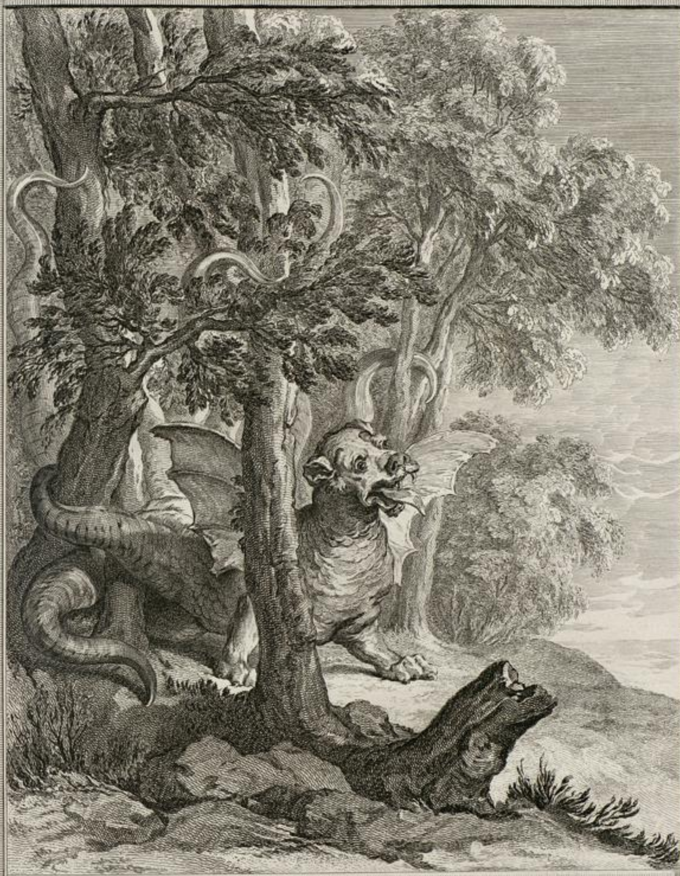
LE DRAGON À PLUSIEURS TÊTES, ET LE DRAGON À PLUSIEURS QUEUËS. Fable XII. 2 e pl.