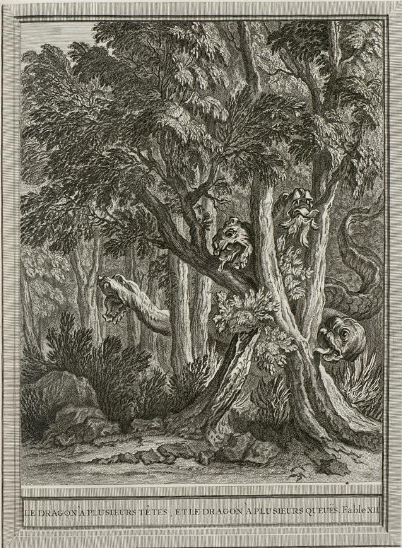
LE DRAGON À PLUSIEURS TÊTES , ET LE DRAGON À PLUSIEURS QUEUES. Fable XII