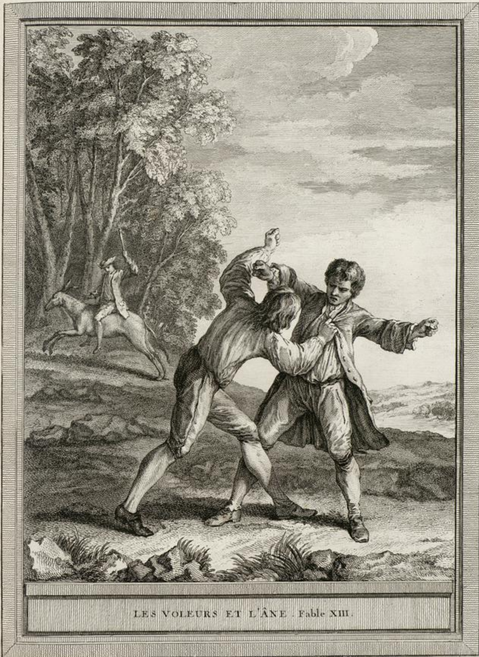
LES VOLEURS ET L'ÂNE . Fable XIII.