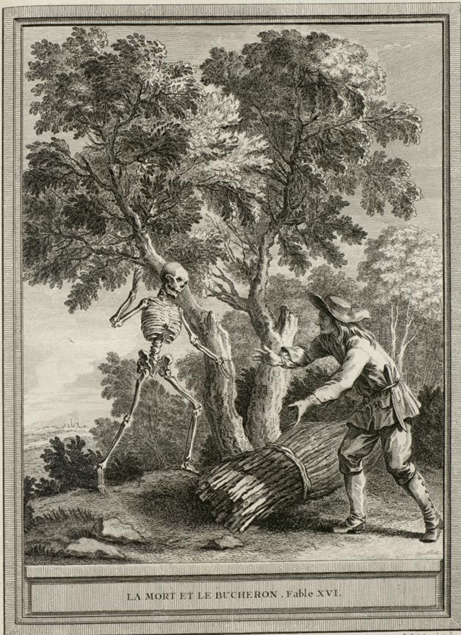
LA MORT ET LE BUCHERON . Fable XVI.