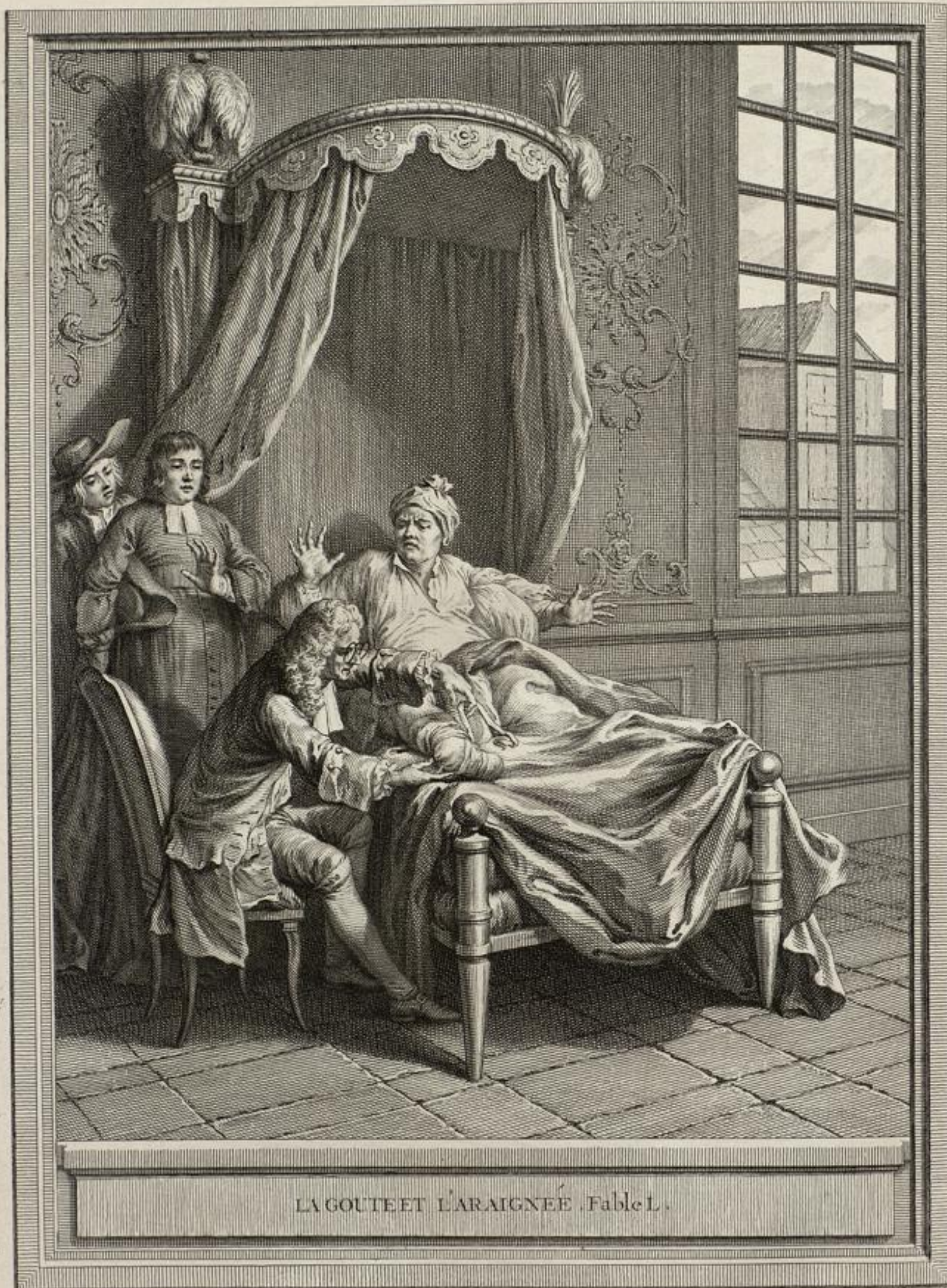
LA GOUTTE ET L'ARAIGNÉE. Fable L.