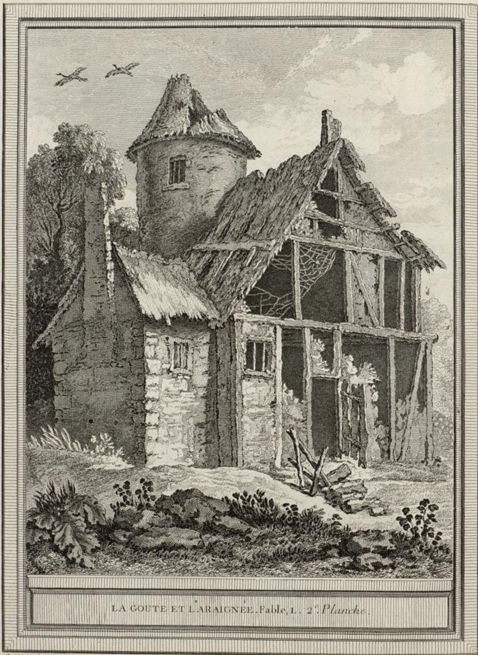
LA GOUTE ET L'ARAIGNEE. Fable, L. 2. Planche.