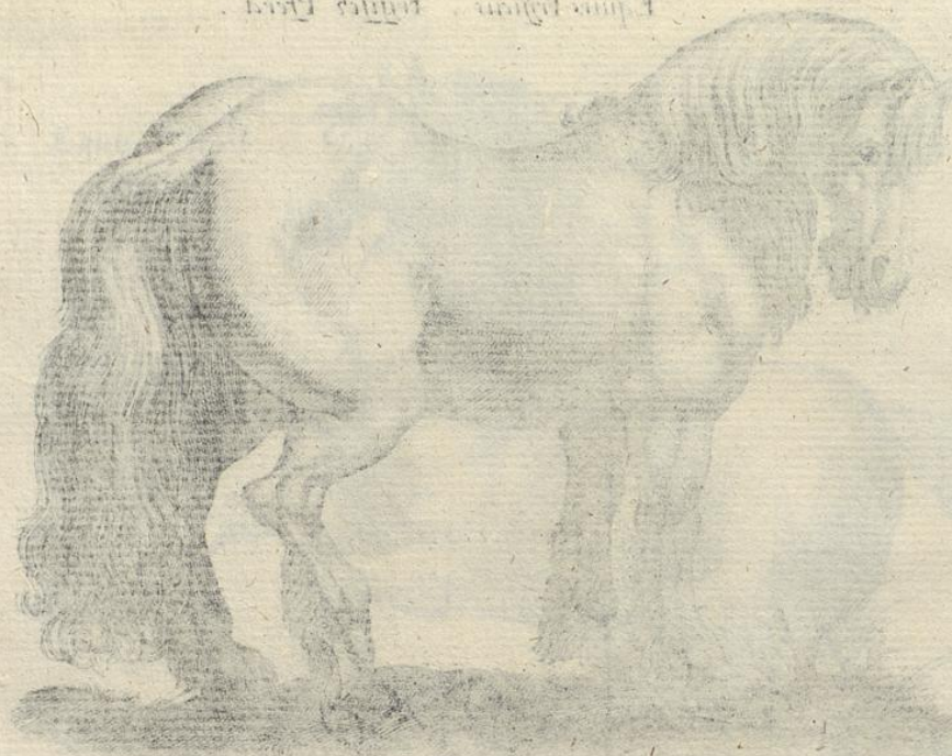
Equus Paganus Equus Domest.