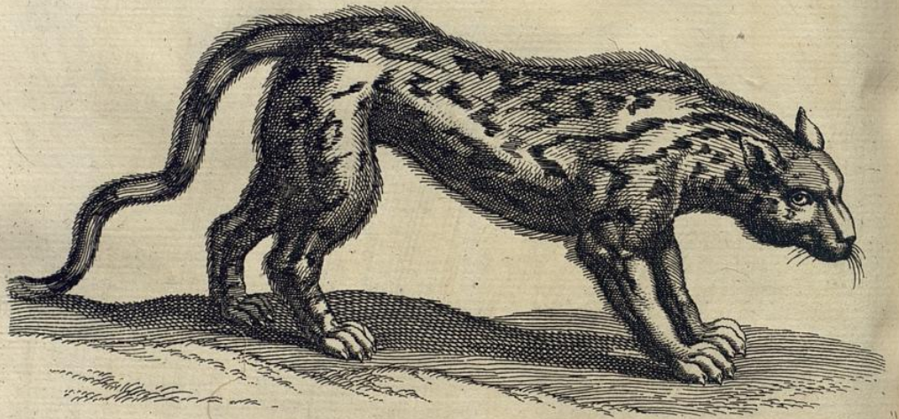
Tigris . Tigerthier .