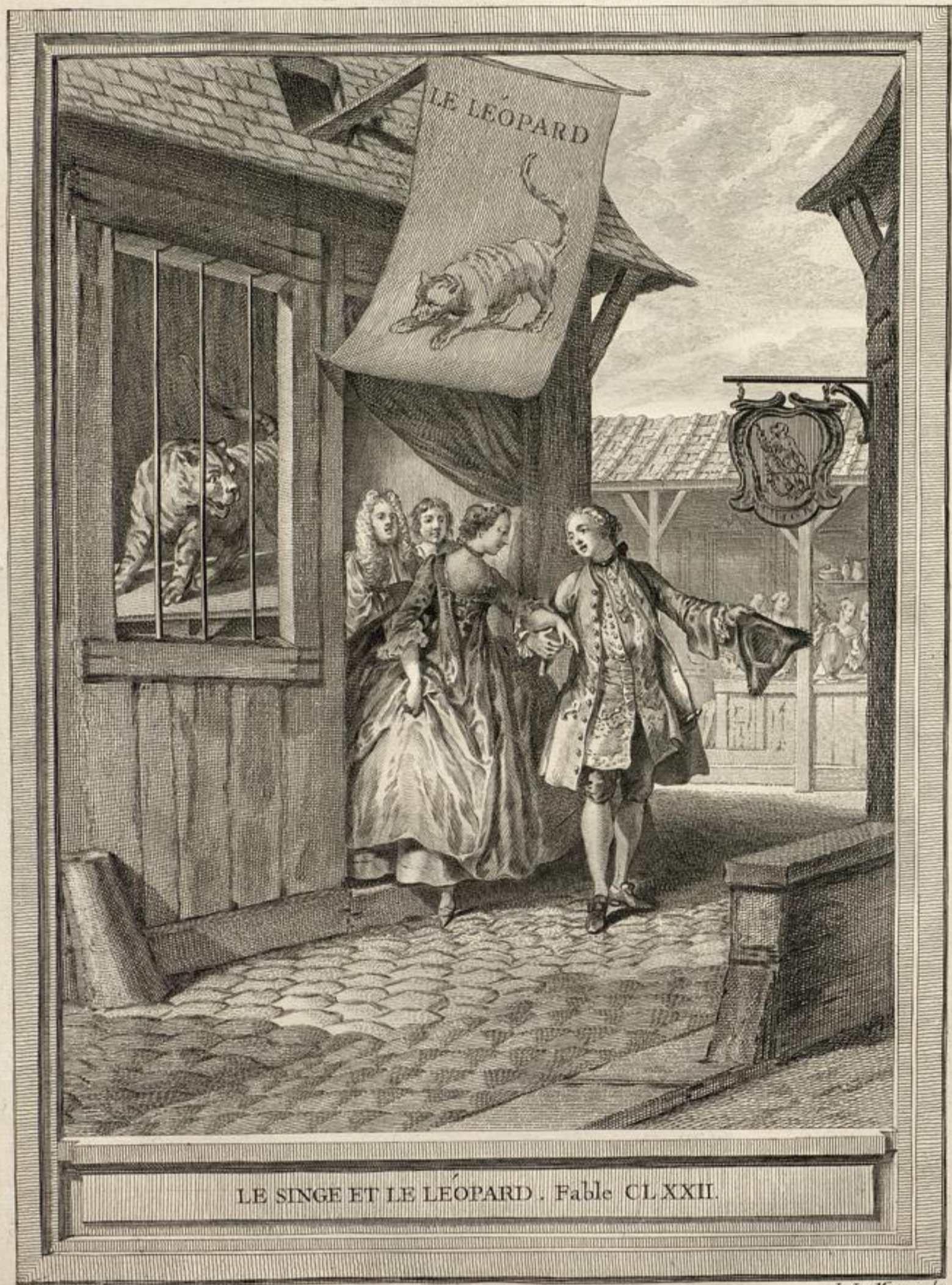
LE SINGE ET LE LÉOPARD. Fable CLXXII.