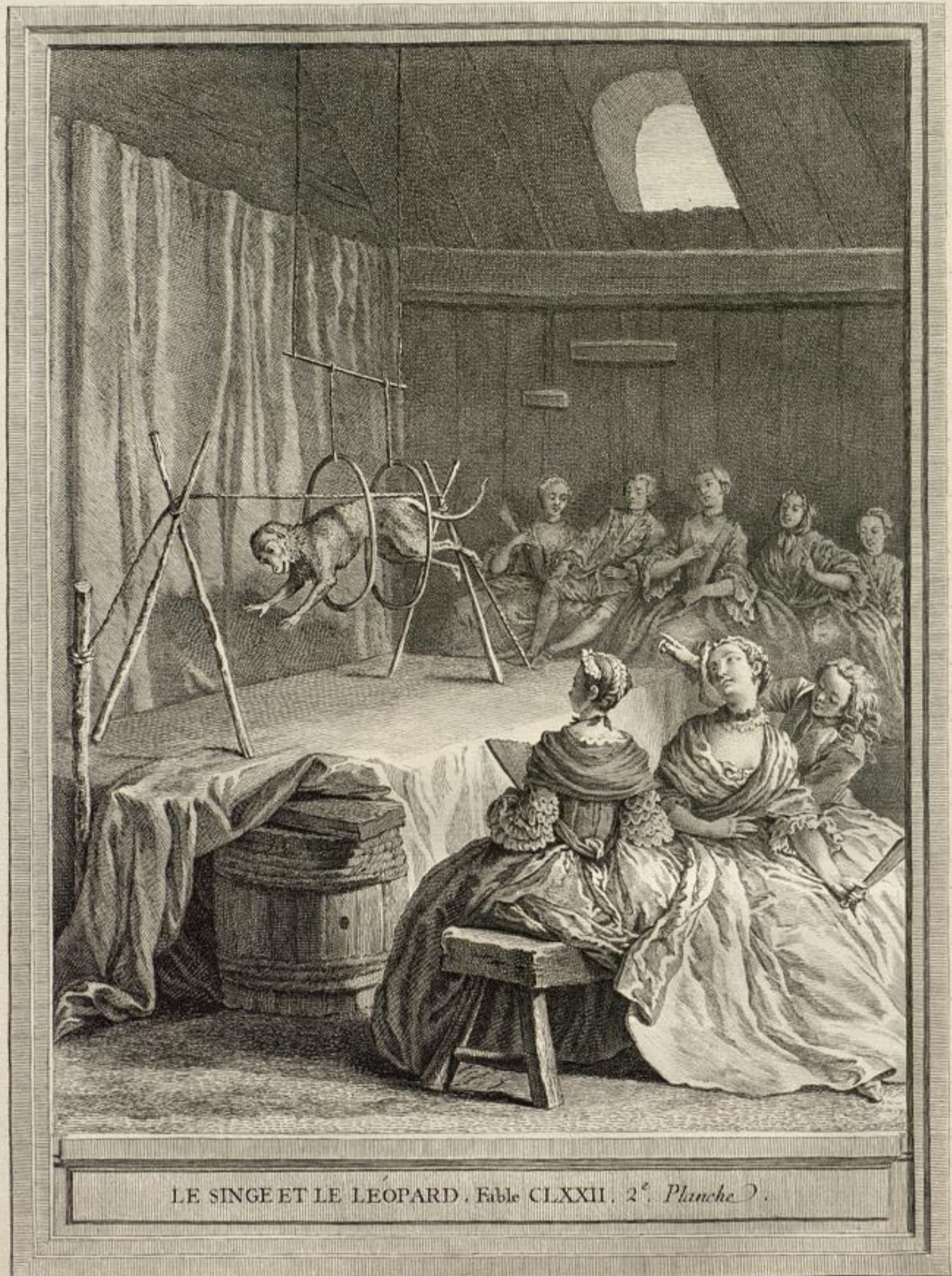
LE SINGE ET LE LÉOPARD. Fable CLXXII. 2 e . Planche D.