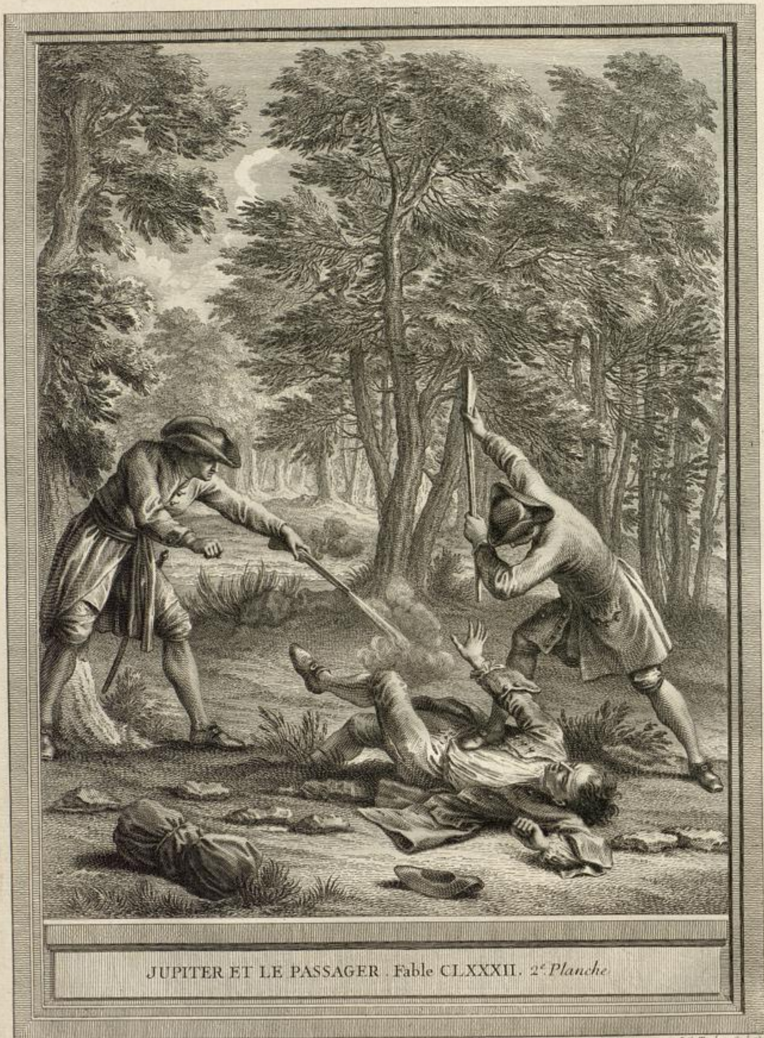
JUPITER ET LE PASSAGER. Fable CLXXXII. 2 e Planche