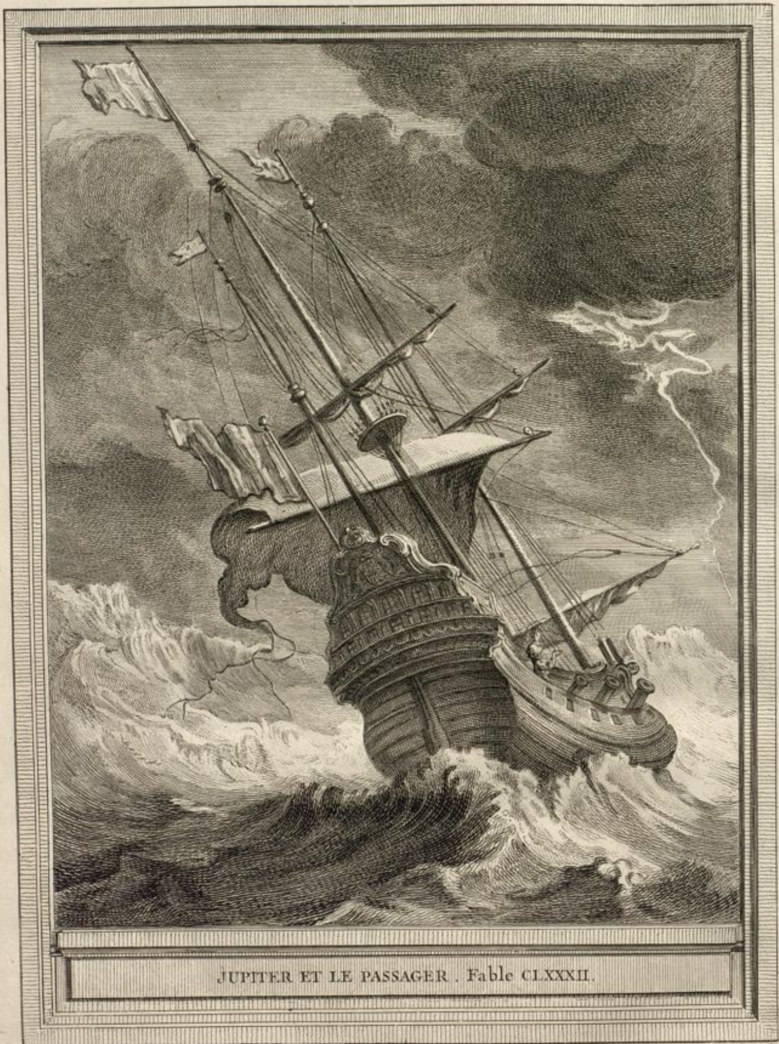
JUPITER ET LE PASSAGER . Fable CLXXXII.