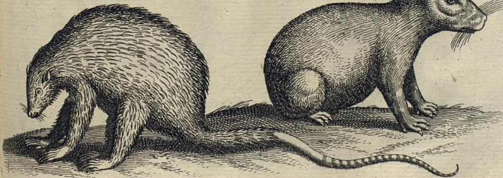
Capy-bara. Porcus flu: viatilis Bras: