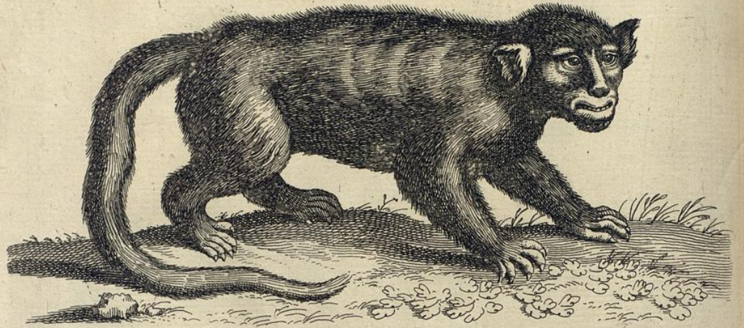
Papio . Pavion i .