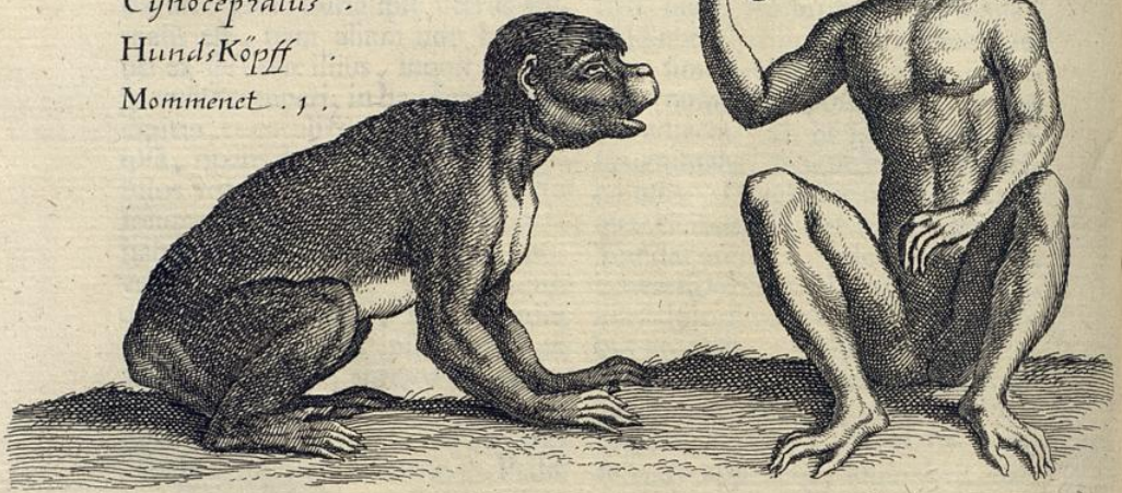
Simia . 2 .