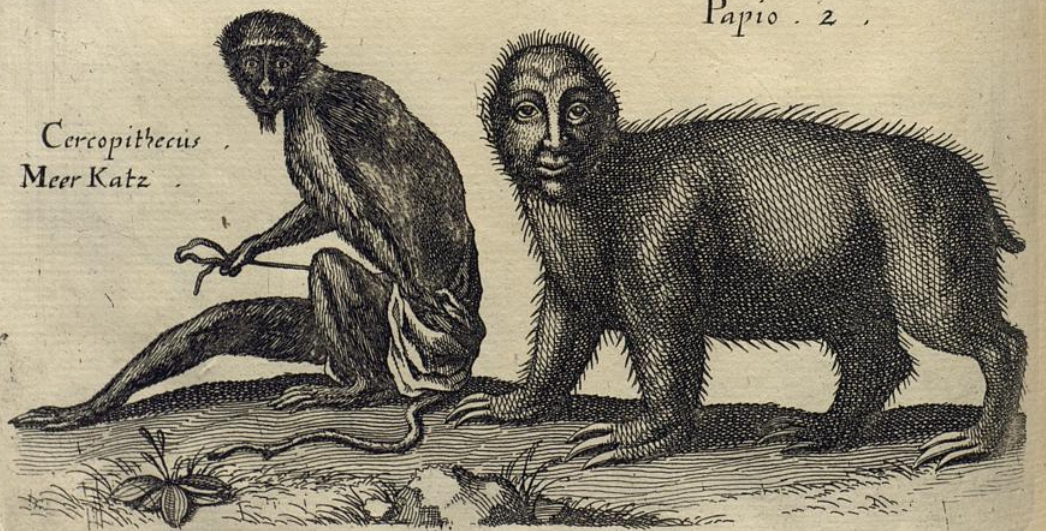
Cercopithecus Meer Katz