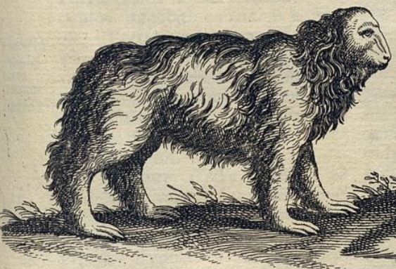
Ignaviu. sive Haut Clusii