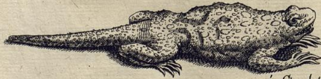
à Circulatoribus fictus