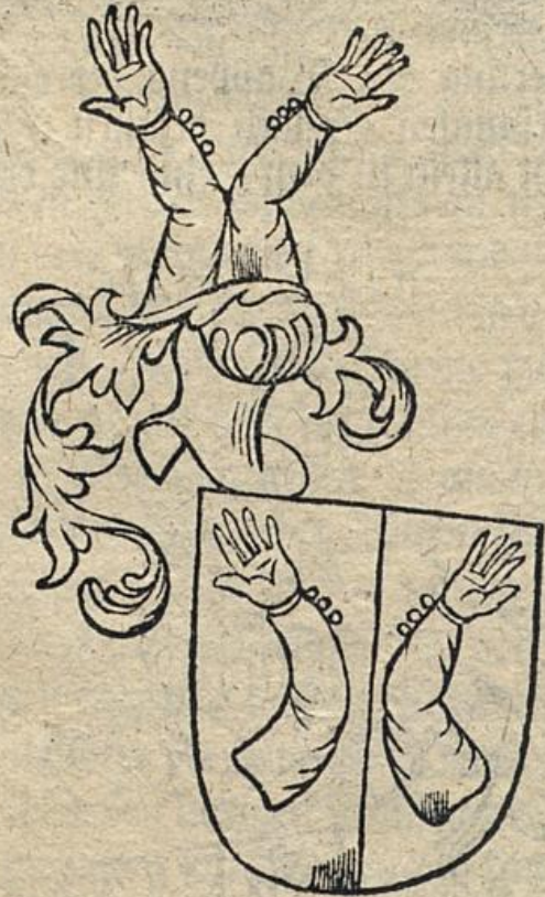
Abbildung des Wappens eines nunmehr ausgestorbenen bürgerlichen Geschlechts, die Siffacher genannt; auch Siffacher aus dem Baselgebiete.