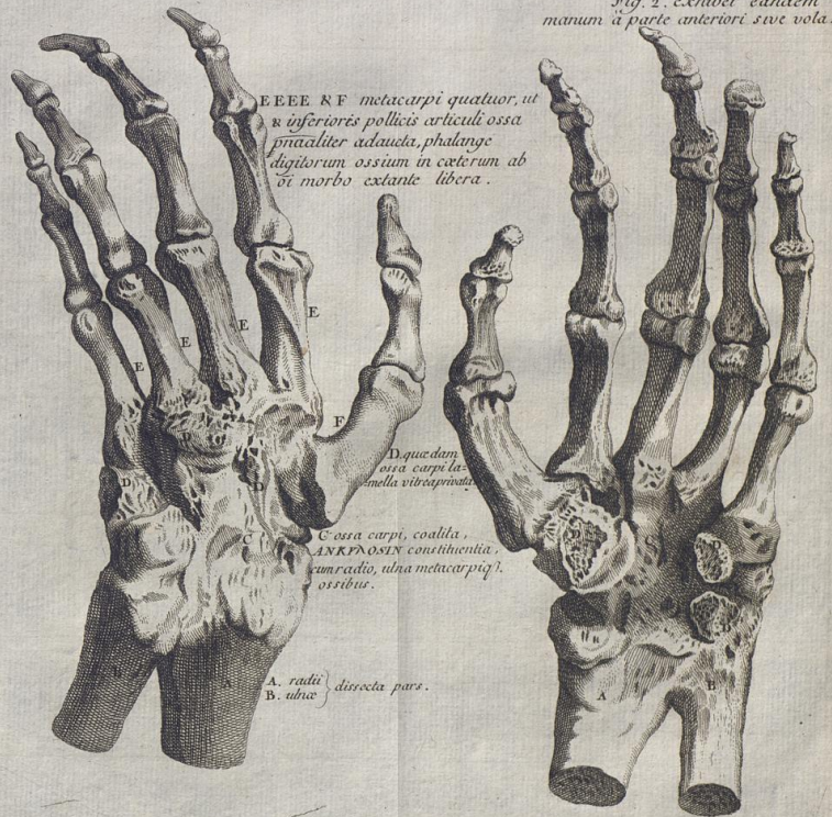
Disp. Chirurg. Tom. IV. MÜLLER DE ANKYLOSI. pag. 543.