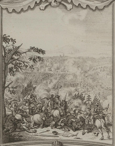
Bataille in der 29ten Monat des grolichen A. 1709 den 2. Febr.

Don Louis Emanoel von Portocarrero Cardinal wie auch Erz- Bischoff zu Toledo Titular-Bischoff von Palastina zuul. Conventor vom Orden des H. Geistes ein Mitglied aller Raths Collegiora in Spanien Vice-König in Sicilien Extra ordinari- Gesandter an den Römischen Hof General Lieutenant zur See in zweimal Ober Regent in Spanien.