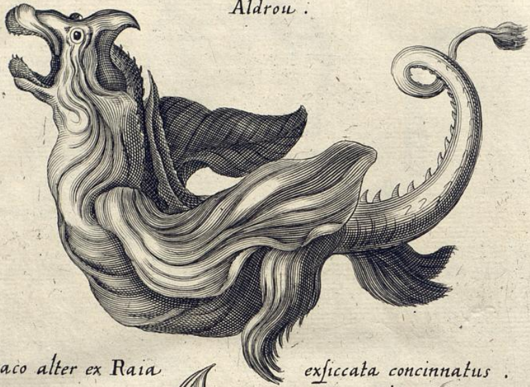
Draco alter ex Raia exsiccata concinnatus . Aldro .