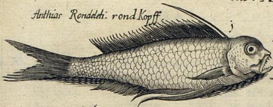
Anthias Rondelli: rond Kopf